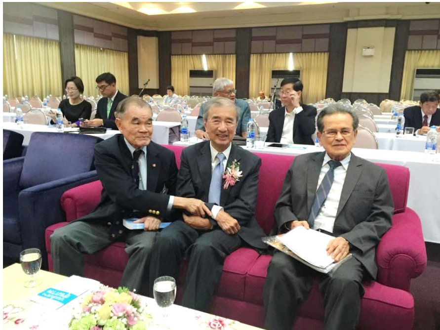
ภาพเพื่อนเก่าพบกันวันบำราศนราดูร