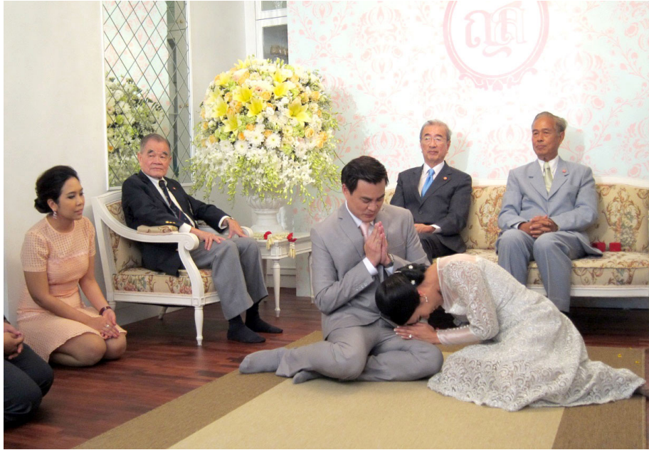
ภาพวันสู่ขอที่บ้านฝ่ายหญิง