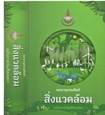
พจนานุกรมศัพท์สิ่งแวดล้อม

ชีวิตที่ราชบัณฑิตยสถาน เราสนิทกันมาก ช่วงที่คุณหมอเป็นนายกราชบัณฑิตยสถาน ทุกมื้ออาหารกลางวันคุณหมोजะชวนให้เข้าไปคุยในห้อง ช่วงนั้นคุณหมอดำเนินการให้ผู้เขียนเป็นบรรณาธิการวารสารราชบัณฑิตยสถาน เพื่อปรับปรุงคุณภาพ และแต่งตั้งผู้เขียนให้เป็นประธานกรรมการจัดทำพจนานุกรมศัพท์แพทยศาสตร์ และประธานกรรมการจัดทำพจนานุกรมศัพท์สิ่งแวดล้อมที่พิมพ์เผยแพร่แล้วเมื่อ พ.ศ. ๒๕๖๕