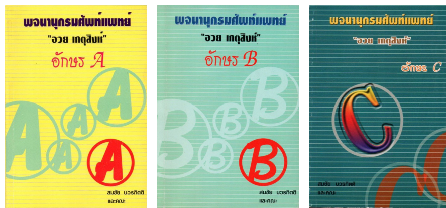
ภาพที่ ๓ ศัพท์แพทย์ อักษร A, B, C (ปกหลังด้านนอก)