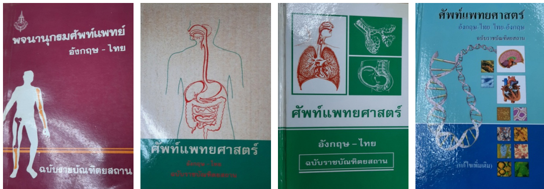
ภาพที่ ๒ ภาพปกหนังสือพจนานุกรมศัพท์แพทย์ ฉบับราชบัณฑิตยสถาน ซึ่งเริ่มจัดพิมพ์เป็นรูปเล่มตั้งแต่ พ.ศ. ๒๕๔๓ เป็นต้นมา (ปกหลังด้านนอก)